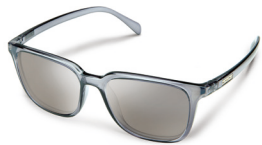
TRANSPARENT GRAY / SILVER MIRROR ¥7,500 (税抜)