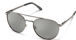
MATTE GUNMETAL / GRAY ¥7,900 (税抜)