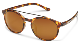
TORTOISE / BROWN ¥7,500 (税抜)