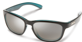
AQUA BACKPAINT / SILVER MIRROR

品格ある丸みのあるフォルムが愛おしい。アウトドアにドライブ、あなたがCINCOを手に入れたなら、使いたいシーンはどんどん増えていくだろう。