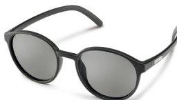
MATTE BLACK / GRAY

丸い正円型レンズ&フレームが優しい雰囲気醸し出してくれる。アウトドアシーンでレトロな雰囲気演出する。