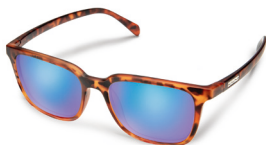
MATTE TORTOISE / BLUE MIRROR ¥7,500 (税抜)