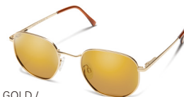
GOLD / SIENNA MIRROR ¥7,900 (税抜)