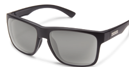
MATTE BLACK / GRAY ¥7,500 (税抜)