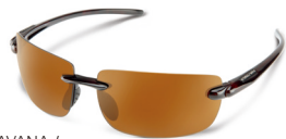
HAVANA / BROWN ¥7,500 (税抜)