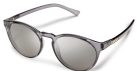
TRANSPARENT GRAY / SILVER MIRROR ¥7,500 (税抜)