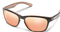
ROSE BACKPAINT / PINK GOLD MIRROR