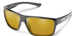
BLACK / YELLOW ¥7,500 (税抜)