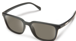
MATTE BLACK / GRAY ¥7,500 (税抜)

丸みを帯びたスクエアなレンズシェイプ。 フィットの良いオーソドックスなユニセックスモデル。