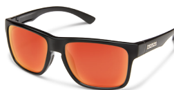
BLACK / RED MIRROR ¥7,500 (税抜)