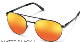
MATTE BLACK / RED MIRROR ¥7,900 (税抜)