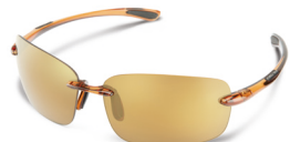
TRANSLUCENT BROWN / SIENNA MIRROR ¥7,500 (税抜)