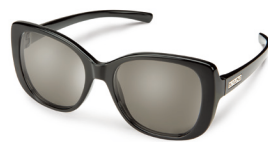
BLACK / GRAY ¥7,500 (税抜)

パタフライ系フロントフレームをより特徴 的にエッジの効いたデザインを施した。 新エレガントスタイル。