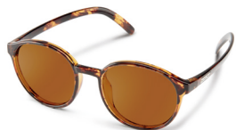
TORTOISE / BROWN