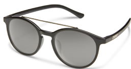
BLACK / GRAY ¥7,500 (税抜)

より個性的なデザインが印象的なラウンド型フレームに、アクセントのメタルブローを取り入れたハイブリッドモデル。