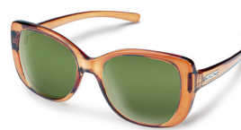
TRANSPARENT BROWN / GRAY GREEN ¥7,500 (税抜)