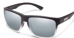
BLACK GRAY FADE / SILVER MIRROR ¥7,500 (税抜)