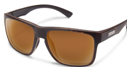
BLACKENED TORTOISE / BROWN ¥7,500 (税抜)

クラシックなウェリントンデザイン。誰にでも対応するオーソドックスな定番スタイル。