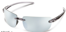
SMOKE / SILVER MIRROR ¥7,500 (税抜)