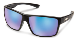
MATTE BLACK / BLUE MIRROR ¥7,500 (税抜)

フラットトップ形状のラージフィットモデル。 大きなレンズで視界が広く、様々なシーン で使用できるニュースタンダード。