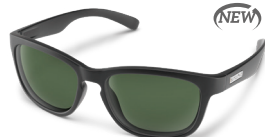
MATTE BLACK / GRAY GREEN