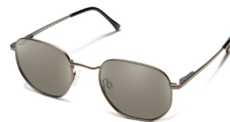
MATTE GUNMETAL / GRAY ¥7,900 (税抜)

個性のあるティアドロップスタイルのフレームはフラットに近く日本人にフィットする。庭の草刈りから3つ星レストランまで難なく乗りこなすアップカマー。メタルフレームが世界中で流行りだした今年、DEL RAYで新しいあなたに挑戦しよう。