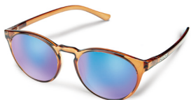
TRANSPARENT BROWN / BLUE MIRROR ¥7,500 (税抜)

レトロスタイルにはラウンドフレームを チョイス。ミディアムフィットで視界も広く、 アウトドアシーンでも活躍。