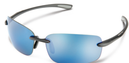
MATTE BLACK / BLUE MIRROR ¥7,500 (税抜)