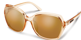
CRYSTAL PEACH / BROWN